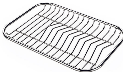
GRILLE PORTE-ASSIETTES INOX 25x35 A100 A54

* uniquement en combinaison avec l'accessoire A644 F04