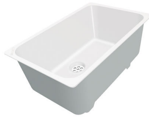
CUVETTE PLASTIQUE BLANCHE A153 A00

* uniquement en combinaison avec l'accessoire A644 F04