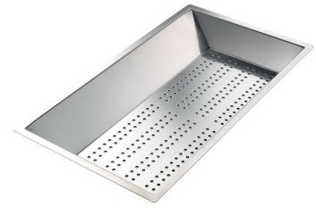
CUVETTE INOX PERFOREE A151 F00 * uniquement en combinaison avec l'accessoire A644 A01