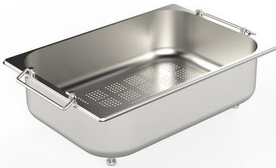
CUVETTE PERFOREE INOX A154 F00

* uniquement en combinaison avec l'accessoire A644 F04