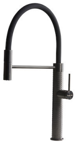
INCISO GUN METAL R424 S56