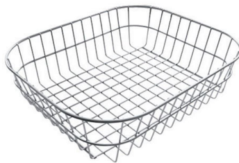
PANIER INOX POUR CUVE 34x40 CM A611 F00