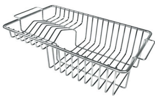
GRILLE PORTE-ASSIETTES INOX 250x425 A100 B01

* uniquement en combinaison avec l'accessoire A644 A01