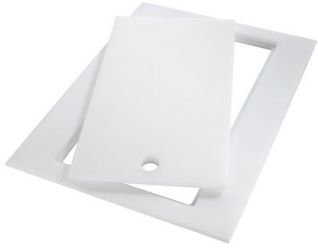
PLANCHE DE DECOUPE DOUBLE HDPE A644 A01