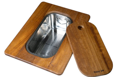
PLANCHE DE DECOUPE DOUBLE IROKO A644 F44